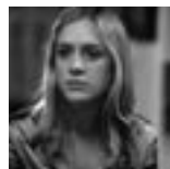
MELINDA A MELINDA MELINDA AND MELINDA USA 2004 WOODY ALLEN

Celovečerní groteska jako výzva prověřující schopnosti tvůrců i možnosti filmového média. Skřítek je svého druhu zajímavý experiment: komedie beze slov, obdařená zvládnutými zvukovými a doprovozená hudbou kapely Mig 21. Snímek nabízí velkorysou příležitost pro pantomimické schopnosti herců. Poetika humoru divadla Sklep a zejména předchozích filmů Tomáše Vorla nalezla ve Skřítkovi svůj průsečík. Jako inspirační zdroj lze chápat zejména segment Cesta na Karlštejn z Pražské pětky. Skřítko můžeme vnímat coby rozpravu o pučení, nadouvání se a nácipávání. Nácipávána jsou střívka párků v masokombinátu a hladová ústa požívačnických lidí. Nadouvají se nejen hlavní hrdina, nýbrž i jeho synek s kamarádem, kteří chtějí dát rozpučet vztahu ke dvěma spolužačkám. Otec se čepýří před mladistvou kolegyní a matka se zase zálibně zhlíží v novém spodním prádle. Pozoruhodná je umanutost tvůrců ve věci zvukového a obrazového detailu. Zvuky jako gagy (kulometná palba linoucí se z televizoru během večerní rodinné siesty), makrodetaily jako vizuální rozbušky a intenzifikace naturalismu v jednání postav.