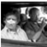
BOKOVKA SIDEWAYS USA 2004 ALEXANDER PAYNE

PAUL GIAMATTI, THOMAS HADEN, VIRGINIA MADSENOVÁ