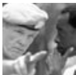
HOTEL RWANDA HOTEL RWANDA JAR-USA 2004 TERRY GEORGE

DON CHEADLE, SOPHIE OKONEDOVÁ, NICK NOLTE