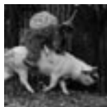
SKŘÍTEK ČR 2005 TOMÁŠ VOREL

Film jako řemen a svěží komedie, které je obsahová a hlavně formální rozpačitost cizí. Nový Šulíkův film lze inspiračně spojovat s britskou sociální komedií Do naha a snad ještě více s filmy Kena Loache. Sluneční stát je formálně sympaticky neučesané dílo (záměrná „dýchavičnost“ či „ukoktanost“ střihu), v němž je autorský smysl pro realistické vidění světa i charakterů ozvláštněn drobnými poetizujícími vsuvkami. Ty jsou utvářeny méně obvyklými úhly záběrů, střídavě zesílenou světelností a nejpatrněji pak specifickými odskoky po ose snímání při transfokaci kamery, které charakterizují v nájezdu i odjezdu genius loci opuštěných šachet a omšelých továrních hal. Herecké obsazení respektuje koprodukční rozvržení díla. Vzácné sevřený a výrazově pečlivě odstíněný je herecký projev všech Šulíkových herců, což platí i pro ženské a vedlejší postavy. Scénář modeluje jednotlivé figury jako osobnosti zasazené do příslušných sociálních kontextů. Postavy mají své domovy, milenky, rodiny i starosti; jsou vylíčeny s přesností a nepodléhají nežádoucím zploštění nebo karikatuře. Kandidát na československý film roku? Vážení přátelé, ano.