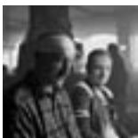
SLUNEČNÍ STÁT ANEB HRDINOVÉ DÉLNICKÉ TŘIDY ČR-SR 2005 MARTIN ŠULÍK

Píše se rok 1993, ve Rwandě vypukla kmenová válka mezi Bhuty a Tucii. Celý svět v čele s OSN fatálně selhal a nyní jen bezmocně přihlíží prostřednictvím médií jednomu z nejmasovějších a nejkrutějších pogromů od konce 2. světové války. Paul Rusesabagin je manažerem hotelu, který za normálních okolností slouží diplomatické smetánce a bohatým cizincům. Bez váhání otevře brány luxusního resortu bezbranným uprchlíkům. Těch se tam až do konce konfliktu postupně tisíní 1268. Hotel Rwanda jako film vyniká v několika ohledech: takřka dokumentární pojetí propojené se skvělými hereckými výkony vykresluje plastický obraz hrůzných událostí, aniž by se stávalo popisným. Bezprostřední zobrazení násilí bylo omezeno ve prospěch předvedení jeho důsledků. Zaslouhou tvůrců je však zejména to, že se pokusili postihnout kontext – historický i globální – který tvoří neodlučitelné pozadí a z nějž barbarství proti lidskosti povstalo. I když není Hotel Rwanda zcela výjimečný film, je zdařilý do té míry, že dokáže působivě zobrazit a kriticky zhodnotit události doby nedávno minulé a emocionálně zaangažovat publikum, a probudit v něm tak pocit spoluzodpovědnosti za svět, ve kterém žijeme.