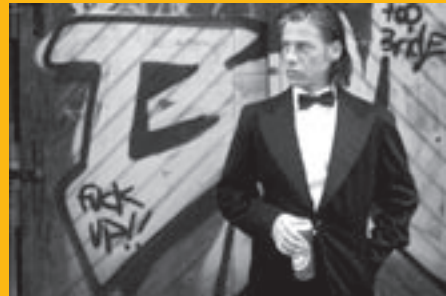
TITULNÍ STRANA: PROTI ZDI FATIH AKIN